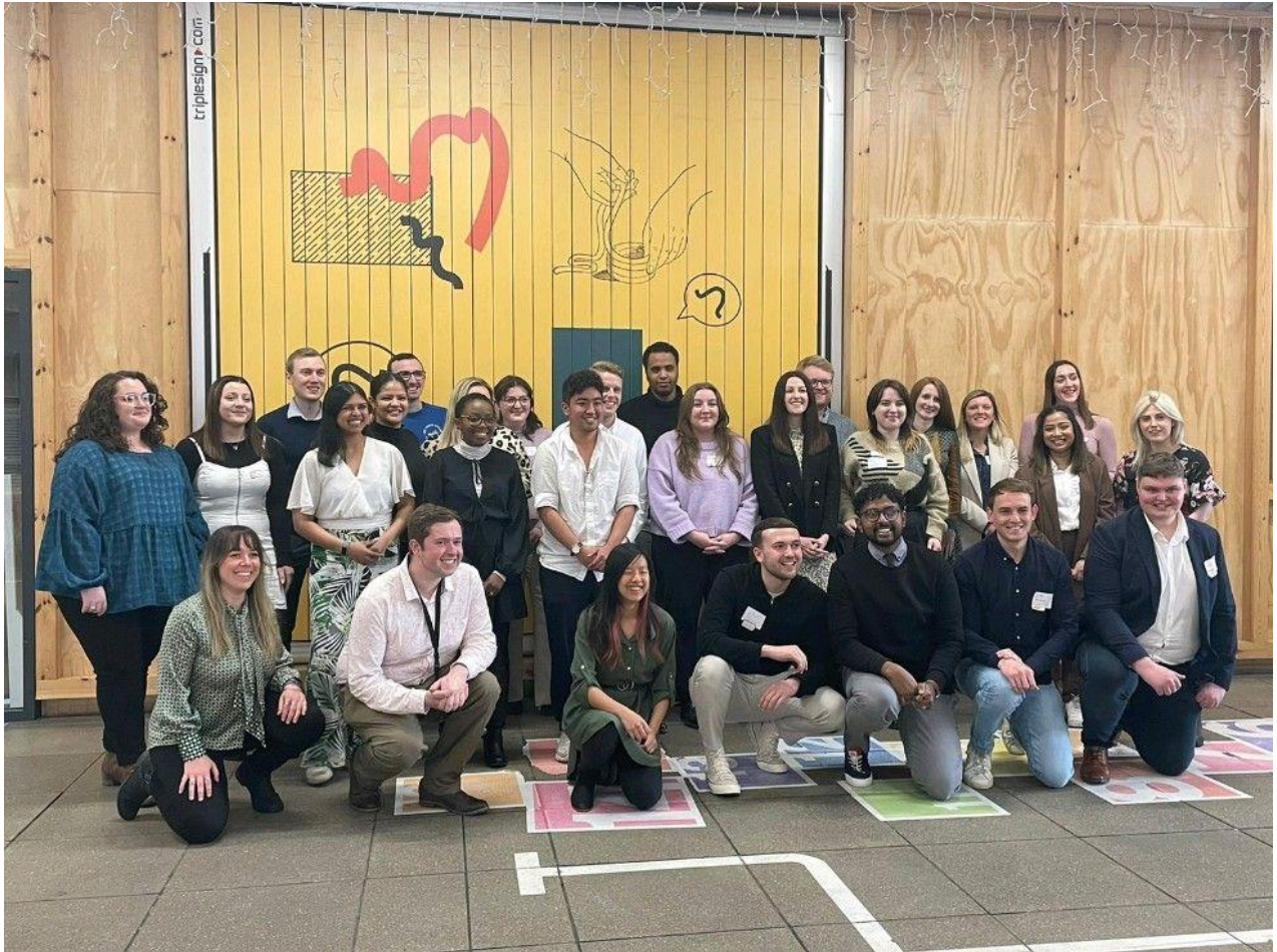
Uchod: Y garfan yn Wrecsam yn dilyn diwrnod o wrando ar Gyrrff Cyhoeddus yn son am y modd y maent yn gweithredu'r Ddeddf Llesiant Cenedlaethau'r Dyfodol.