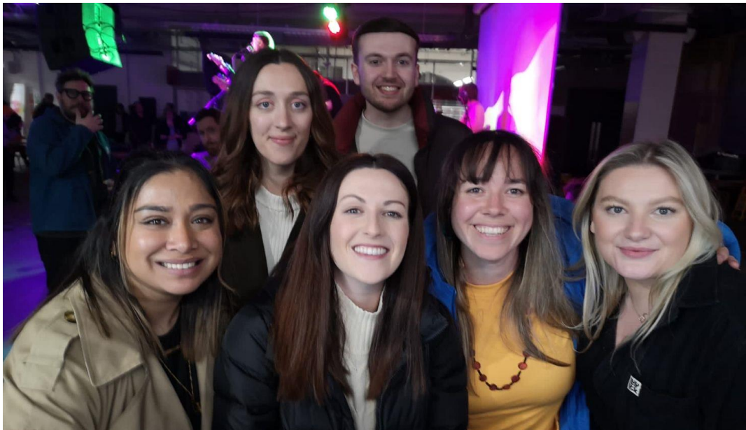
Uchod: Grŵp o gyfranogwyr yn cyd-gysylltu mewn digwyddiad cymdeithasol yn Wrecsam ym mis Ebrill 2022.