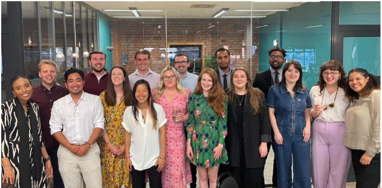
Uchod: Aelodau'r garfan yn cymdeithasu ac yn myfyrion yn swyddfeydd Comisiynydd Cenedlaethau'r Dyfodol yng Nghaerdydd yn dilyn digwyddiad olaf y rhaglen ym mis Mehefin 2022.

Fel Cyfranogydd A, dangosodd Cyfranogydd B hefyd ddatblygiad clir a pharhaus yn eu harweinyddiaeth eu hunain , gyda'u hatebion misol i'r cwestiwn yn gofyn a oedd cynnwys Academi'r mis hwnnw wedi gwella eu taith arweinyddiaeth yn nodi 'Cytuno'n Gryf' bob tro. Roedd y datblygiad nodedig hwn hefyd yn amlwg yn atebion Cyfranogydd B i'r cwestiwn yn gofyn pa mor hyderus yr oeddent yn teimlo fel eiriolydd i'r Ddeddf Llesiant Cenedlaethau'r Dyfodol gyda'u hatebion misol yn mynd o 3 ar ddechrau'r rhaglen, i 5 erbyn diwedd y rhaglen, ar y raddfa hyder, lle'r oedd 1 = dim hyder a 5 = hyderus iawn.