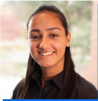
Swyddog Gweithredol Gwasanaethau Pêl- droed Cymdeithas Bêl-droed Cymru