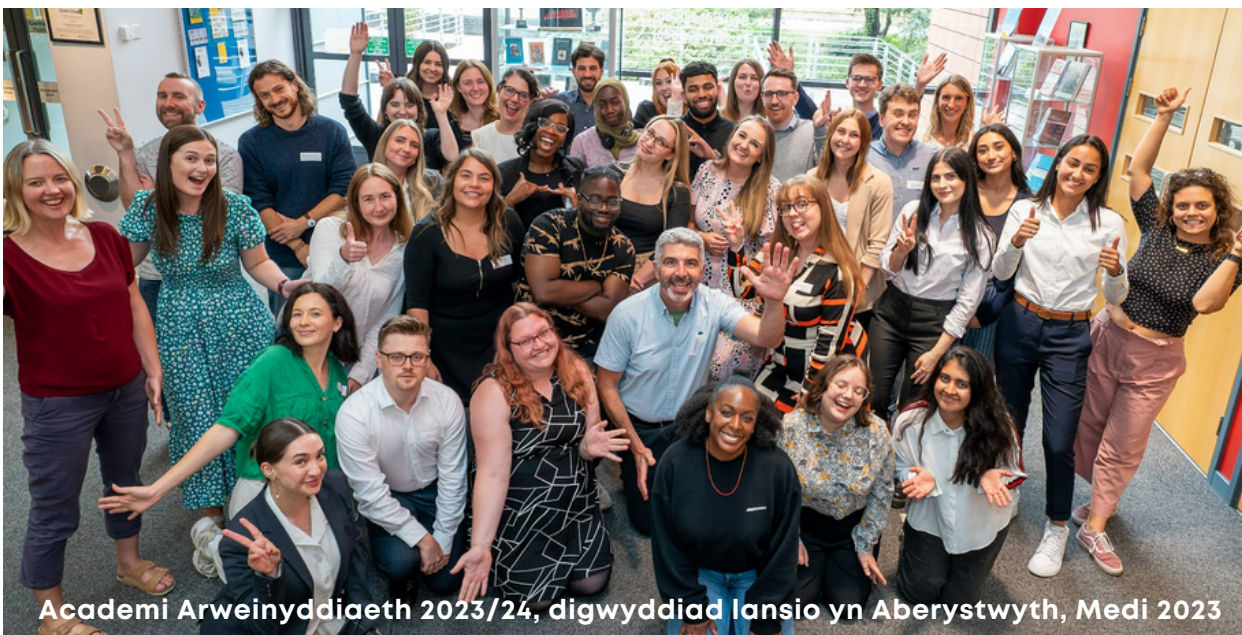
Academi Arweinyddiaeth 2023/24, digwyddiad lansio yn Aberystwyth, Medi 2023