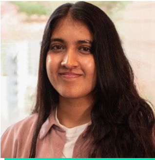
Graddedig Meistr a chynorthwydd ymchwil yng Nghyngor Caerdydd