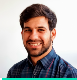
Dylunydd Gwefan a Marchnatwr Digidol