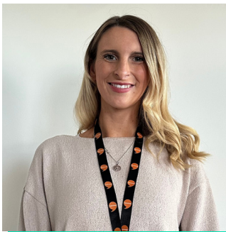
Swyddog Cyfathrebu Digidol Llywodraeth Cymru

Ar hyn o bryd, mae Rhia yn Gydlynnydd Prosiect ar gyfer elusen adfer sy'n gweithio gyda chymunedau brodorol ledled Colombia, Uganda ac India.