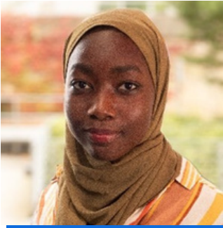
Swyddog Polisi EYST