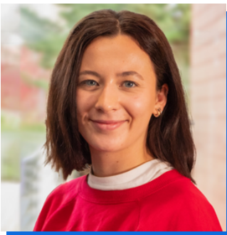
Swyddog Rhyngwladol Urdd