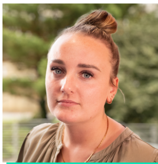
Rheolwr Arolygu Awdurdodau Lleol Arolygiaeth Gofal Cymru