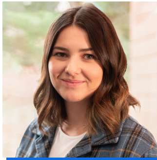
Rheolwr Cadwyn gyflenwi Trafnidiaeth Cymru

Mae Bablu yn angerddol am y diwydiannau creadigol a digidol. Mae'n frwd dros greu cynnwys sy'n ysbrydoli eraill ac yn siarad â'i genhedlaeth. Dyna pam y creodd Radio Plattform Presents! Mae bod yn ffigwr gweithgar yn ei gymuned yn bwysig iawn iddo ac mae'n ymdrechu i adlewyrchu yn ei waith trwy gynrychioli, adrodd straeon ac adloniant. Mae Radio Plattform yn cyflwyno cyfle i bobl greadigol ifanc fynegi eu hunain, dysgu rhywbeth newydd, a rhwydweithio ymhlith pobl eraill o'r un anian.