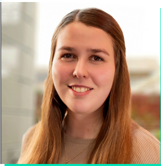
Cynghorydd Arbenigol Cyfoeth Naturiol Cymru