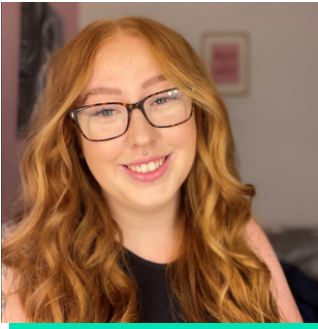
Rheolwr Datblygu Arweinyddiaeth Llywodraeth Cymru