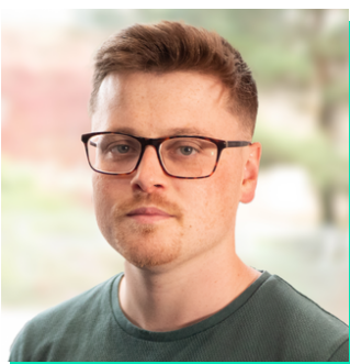
Dirprwy Reolwr Bil Llywodraeth Cymru

Gellir dod o hyd iddo fel arfer yn yfed coffi, yn y gampfa, ac yn ymchwilio i'w goeden deulu (er nid o reidrwydd ar yr un pryd).