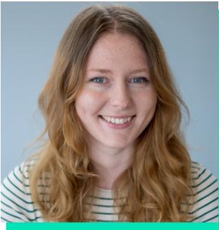
Rheolwr Cynnyrch Canolfan Gwasanaethau Cyhoeddus Digidol