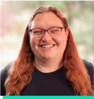
Rheolwr Newid Busnes Addysg a Gwella Iechyd Cymru (HEIW)