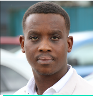
Graddedig yng Ngwasanaeth Cyhoeddus Cymru Gyfan

Gwasanaeth Tân ac Achub De Cymru a Chymdeithas Tai Hafod