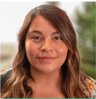
Tîm Profiad Cwsmer Cymdeithas Adeiladu Principality

Gyda'i chefnidir mewn Gwleidyddiaeth a Chysylltiadau Rhyngwladol mae'n gobeithio gallu defnyddio hyn i arallgyfeirio a helpu i hyrwyddo cydraddoldeb rhywiol mewn pêl-droed. Mae ei gwaith fel canolwr yn ei grymuso nid yn unig i gynyddu cyfranogiad swyddogion benywaidd a rhai o leiafrifoedd ethnig, ond hefyd i greu amgylchedd gwell ar gyfer holl ddyfarnwyr diwrnod gêm.