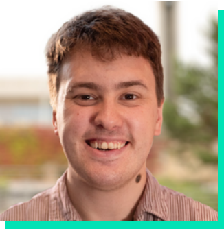
Swyddog Cymorth Cyfathrebu ac Ymgysylltu Archwilio Cymru