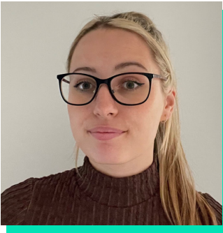
Rheolwr Gweithrediadau Cynorthwyol - Arweinydd NWAS Bwrdd Iechyd Prifysgol Betsi Cadwaladr