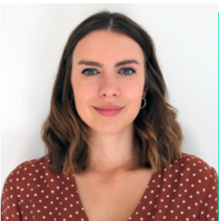
Rheolwr Cyfathrebu Asiant Cefnffyrdd Gogledd a Chanolbarth Cymru