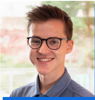
Swyddog Gweithredol Cyngor Gwynedd

Gan gydweithio â chymunedau, mae Ophelia yn canolbwyntio ar rannu sgiliau fel arf pwerus i archwilio cymhlethdodau newid yn yr hinsawdd, gan ysgogi cyfranogiad a gweithredu. Gan hwyluso gweithdai gydag elusennau a sefydliadau lleol, mae'n dangos sut y gellir defnyddio technegau brodwaith syml i drwsio ac ailddyfeisio ffabrig.