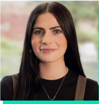
Swyddog Cymorth Gweithredol Swyddfa Comisiynydd yr Heddlu a Throsedd De Cymru