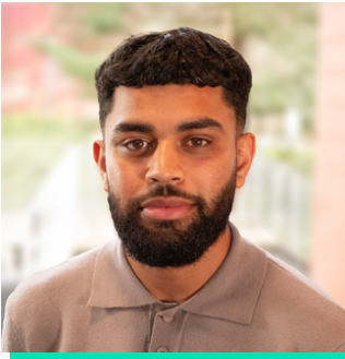
Cyflwynydd, actor, awdur a chreawdwr cynnwys