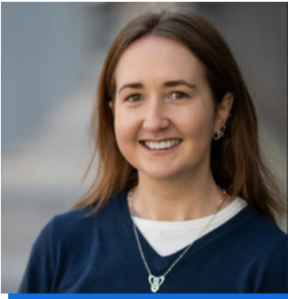
Gweinyddwr Cefnogi Tîm a Chyfieithu Cymraeg Swyddfa Comisiynydd Cenedlaethau'r Dyfodol Cymru