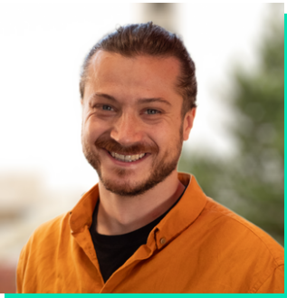
Rheolwr Cyflawni Swyddfa'r Cabinet Llywodraethu Cymru

Mae Cara yn angerddol am yr iaith a diwylliant Cymraeg ac yn ceisio ymgorffori'r angerdd hwn yn ei gwaith bob dydd.