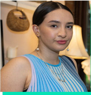
Dylunydd tecstilau, ymchwilydd ac addysgwr