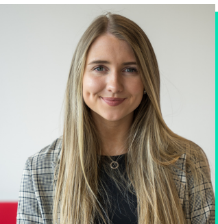
Rheolwr Prosiect Cynorthwyol Trafnidiaeth Cymru

Ei freuddwyd yw i Gymru gael ecosystem biotechnoleg sy'n hybu arloesedd. Ar wahân i hynny, mae hi'n mwynhau gwella prosesau, dod o hyd i ffyrdd newydd o wella'r ffordd yr ydym yn gweithio a helpu pobl i ddod yn fersiynau gorau ohonynt eu hunain. Mae hi'n gobeithio datblygu rheoli risgiau ac ansicrwydd a gwella fy sgiliau cyfathrebu perswadiol.