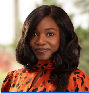
Swyddog Cymorth Prosiect Cyngor Dinas Abertawe